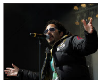
Adel Tawil von «Ich+Ich» begeisterte auf 2580 Metern.

schen Kraftakt vollbrachte die Zermatt Bergbahnen AG. Gemeinsam mit der Matterhorn Gotthard Bahn und der Gornergrat Bahn stemmten sie 80 Tonnen Material von Visp auf den Riffelberg. «Die Fantasti-