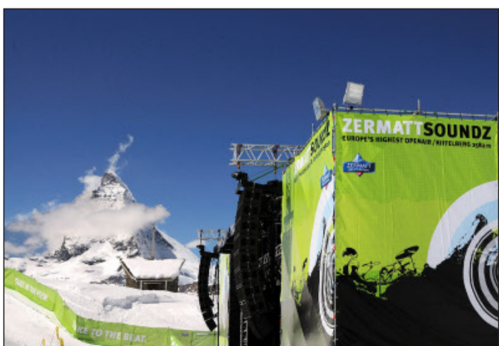
Das «Zermatt Soundz» lockte 2500 Besucher in den Schnee.