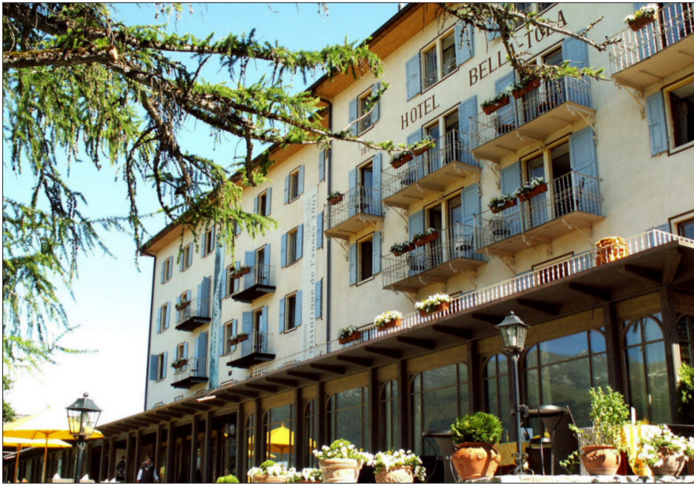
Die Mitglieder der Swiss Historic Hotels trafen sich am Wochenende zur Generalversammlung im Hotel Bella Tola im Val d'Anniviers.